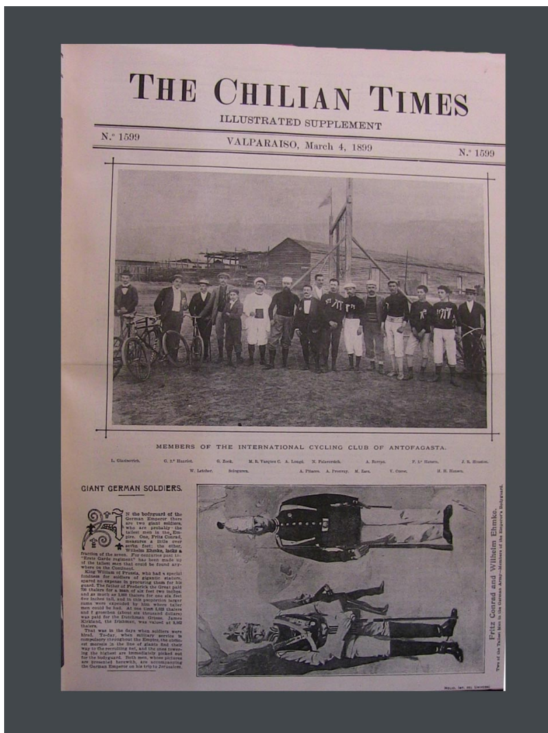
The Chilian Times , 4 mars 1899