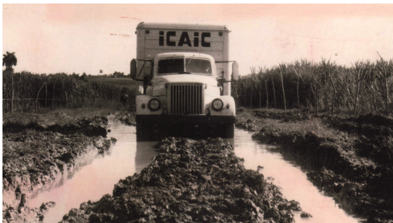
Caminhão do ICAIC, em registro que enfatiza os esforços para levar o cinema a todos os rincões do país. Projeto encampado pelo "cine-móvil" .

A presença internacional, que garantia uma aura de sofisticação à revista, juntamente com o cuidado em estimular o aprimoramento do "fazer cinematográfico" em Cuba nos ajudam a compreender as altas expectativas que vigoraram em seus primeiros anos de existência. A análise da revista nos revela igualmente a imagem que se pretendia construir do Instituto: ao folhear suas páginas, não há como não se entusiasmar com o potencial de um organismo tão novo e que, por meio do cine-móvil , 4 abarcava todas as regiões e cidadãos do país com filmes de temáticas atuais. Além disso, suas páginas davam acesso a informações sobre os festivais europeus, sobre lançamentos editoriais, sobre as estreias nas salas de cinema e traziam fotos de eventos políticos e culturais captados pelas lentes dos documentaristas.