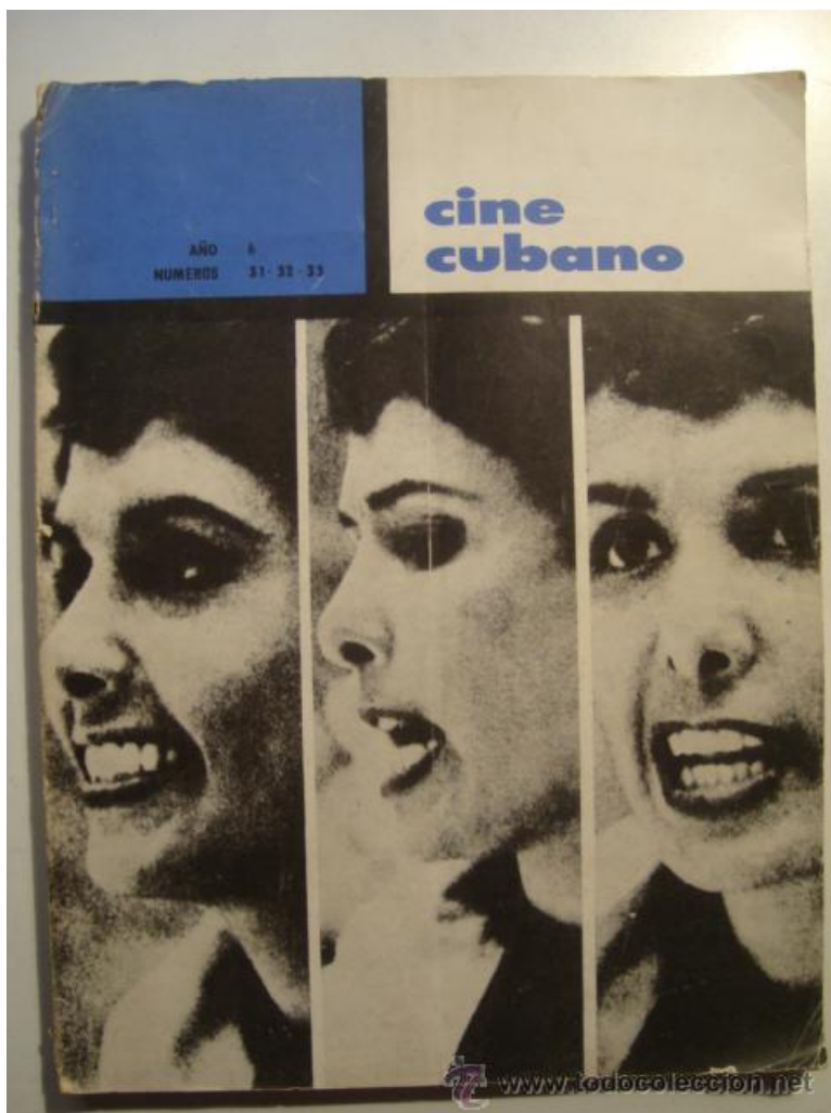
Capa de um número triplo de Cine Cubano (n. 31-32-33), 1966