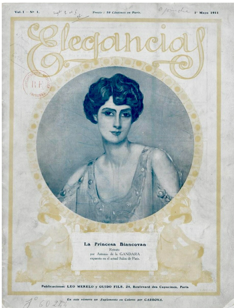
Portada de Elegancias , Volumen 1, Número 1, 1º de mayo de 1911