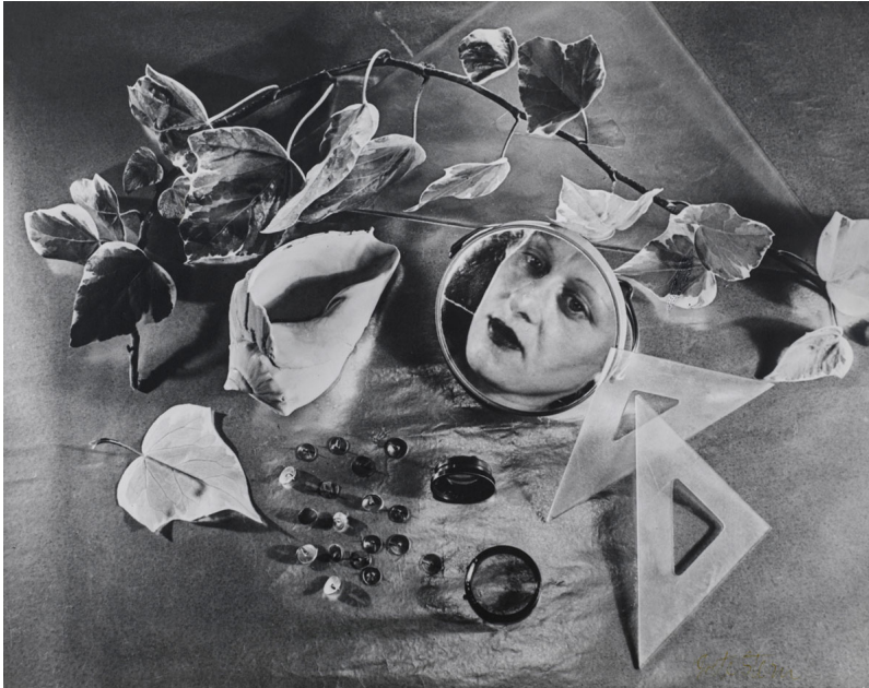
Grete Stern (née en Argentine, 1904-1999) Autoportrait, 1943. Tirage argentique, imprimé en 1958 28 x 22 cm