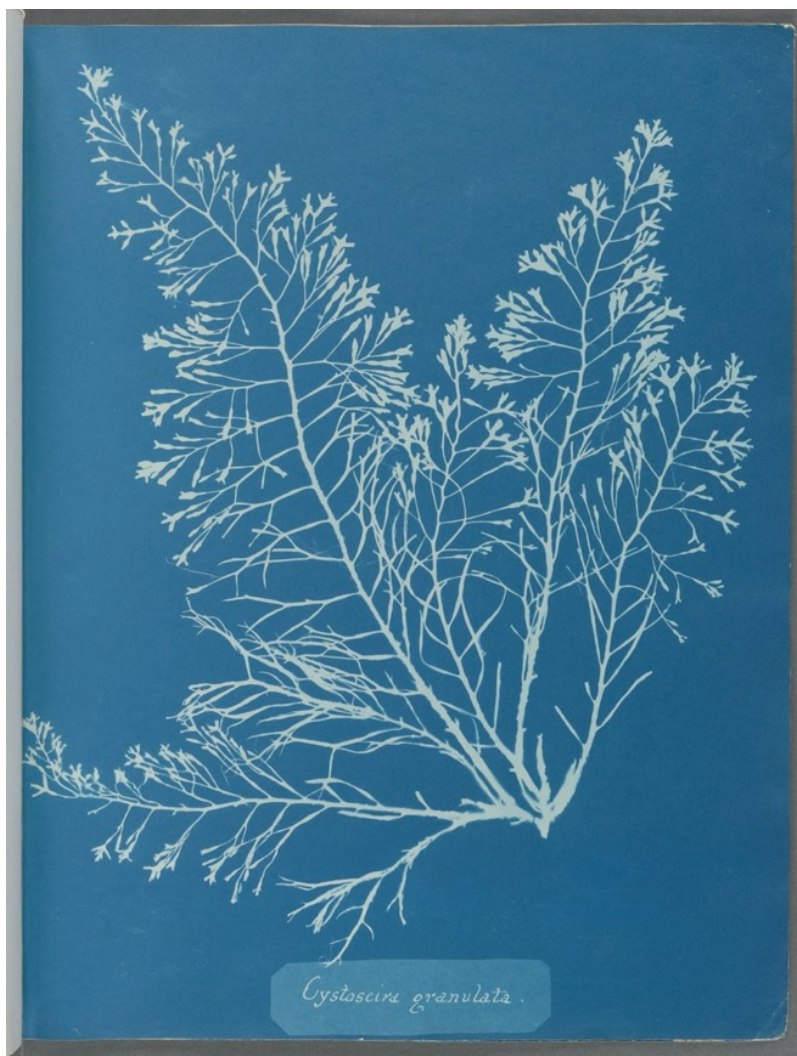
Anna Atkins, Cystoseira Granulata , in Photographs of British Algae , Halstead Place, Anna Atkins, 1843