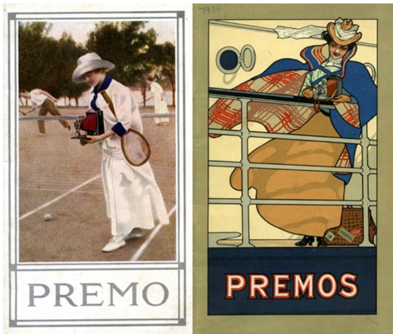
Couvertures de catalogue de produits Kodak, 1912