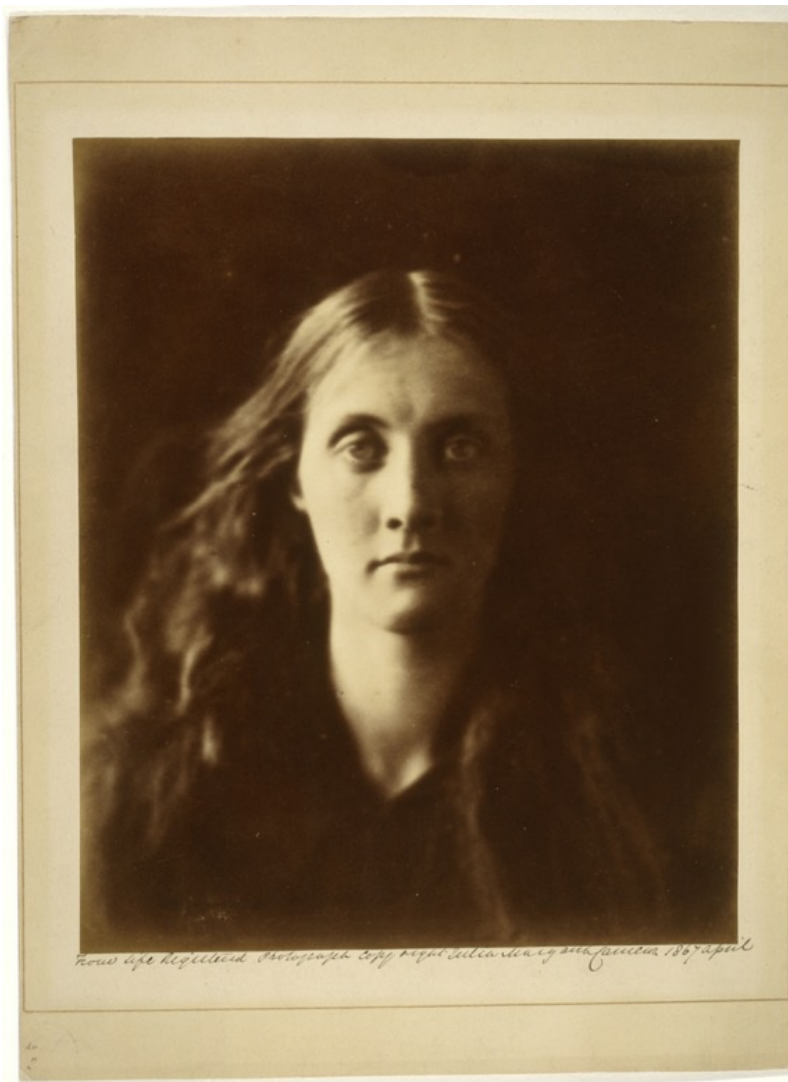
Julia Margaret Cameron, Stella (Julia Duckworth, née Jackson), 1867, 29x24 cm, tirage sur papier albuminé

regard avant-gardiste annonçant les futures expérimentations modernistes. À rebours de toute illusion de transparence, Cameron tire en effet parti de la matérialité des tirages, sur lesquels apparaissent des traces de doigts ou des égratignures. Le récit de sa reconnaissance tardive, faisant d'elle une artiste incomprise, car trop en avance sur son temps, contribue à asseoir sa stature.