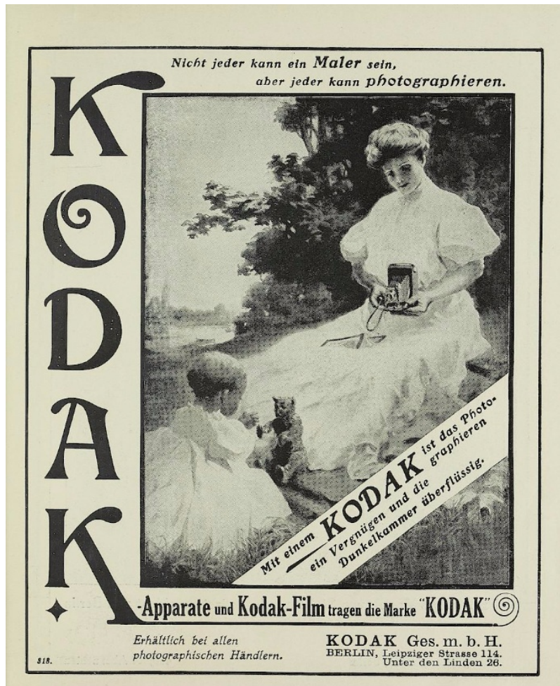
Publicité allemande pour Kodak. Catalogue de la Grande exposition d'art de Berlin (1909)

paquebot ou au volant d'une automobile, incarnant un nouvel idéal progressiste et dynamique. Ces publicités doivent susciter un besoin : en donnant l'exemple de situations dans lesquelles appuyer sur le déclencheur, elles stimulent une culture de la prise de vue, transformée en réflexe face à certains paysages ou certaines occasions. Au-delà du simple boîtier, Kodak fait la promotion d'un mode de vie placé sous le signe de l'émancipation et de l'élégance, associé à d'autres symboles de la modernité comme la voiture. Les lectrices sont appelées à s'identifier à la « Kodak girl », qui change de visage et d'accessoires au fil des réclames pour mieux répondre à toutes les aspirations.