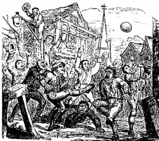
Match de folk ou de mob football à Londres (1721)