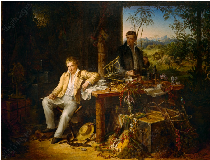
Humboldt et Bonpland sur l'Orénoque peints par Eduard Ender, 1856