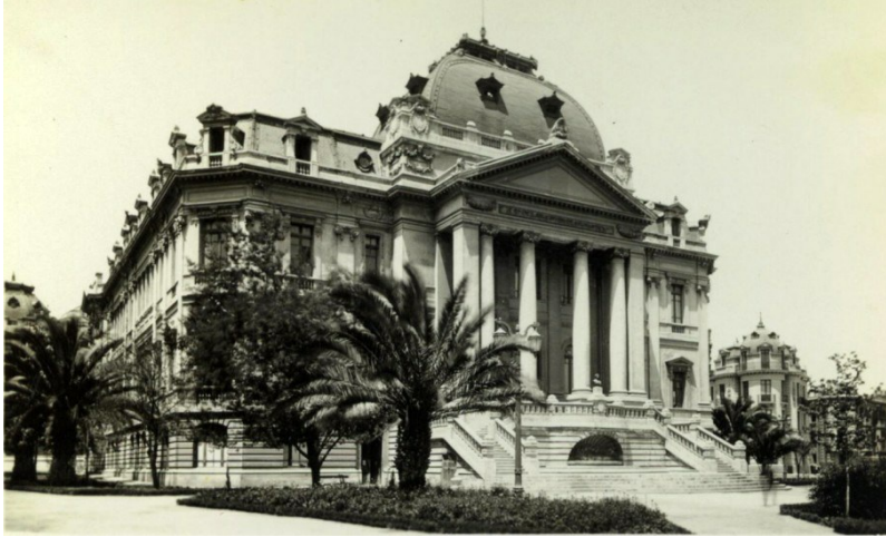
La Escuela de Bellas Artes de Santiago du Chili, 1910

faire durant tout le xix e siècle, et même au-delà. C'est ainsi d'Espagne que vient le peintre José del Pozo, créateur de la Escuela de Dibujo du Pérou en 1791 ; ce sont également des artistes espagnols qui sont les premiers directeurs de l'Escuela Nacional de Bellas Artes de San José au Costa Rica (1897) et de celle de Santo Domingo en République dominicaine (1942) : respectivement le peintre Tomás Povedano et le sculpteur Manolo Pascual. Joseph Guth, peintre suisse installé en Argentine, dirige une école de dessin à Buenos-Aires en 1818. Le Chili fait preuve en la matière d'un grand éclectisme : son académie de peinture, fondée en 1849 sur le modèle parisien (que l'on retrouve jusque dans l'architecture du bâtiment qui l'abrite), est successivement dirigée par un Italien, Alessandro Cicarelli, un Allemand, Ernst Kirchbach, puis encore un Italien, Giovanni Mochi, tandis que sa section de sculpture l'est par le Français Auguste François.