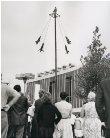
Visitantes de la Feria Mundial de Nueva York (1964-1965) mirando a los "Voladores de Papantla" frente al Pabellón de México.