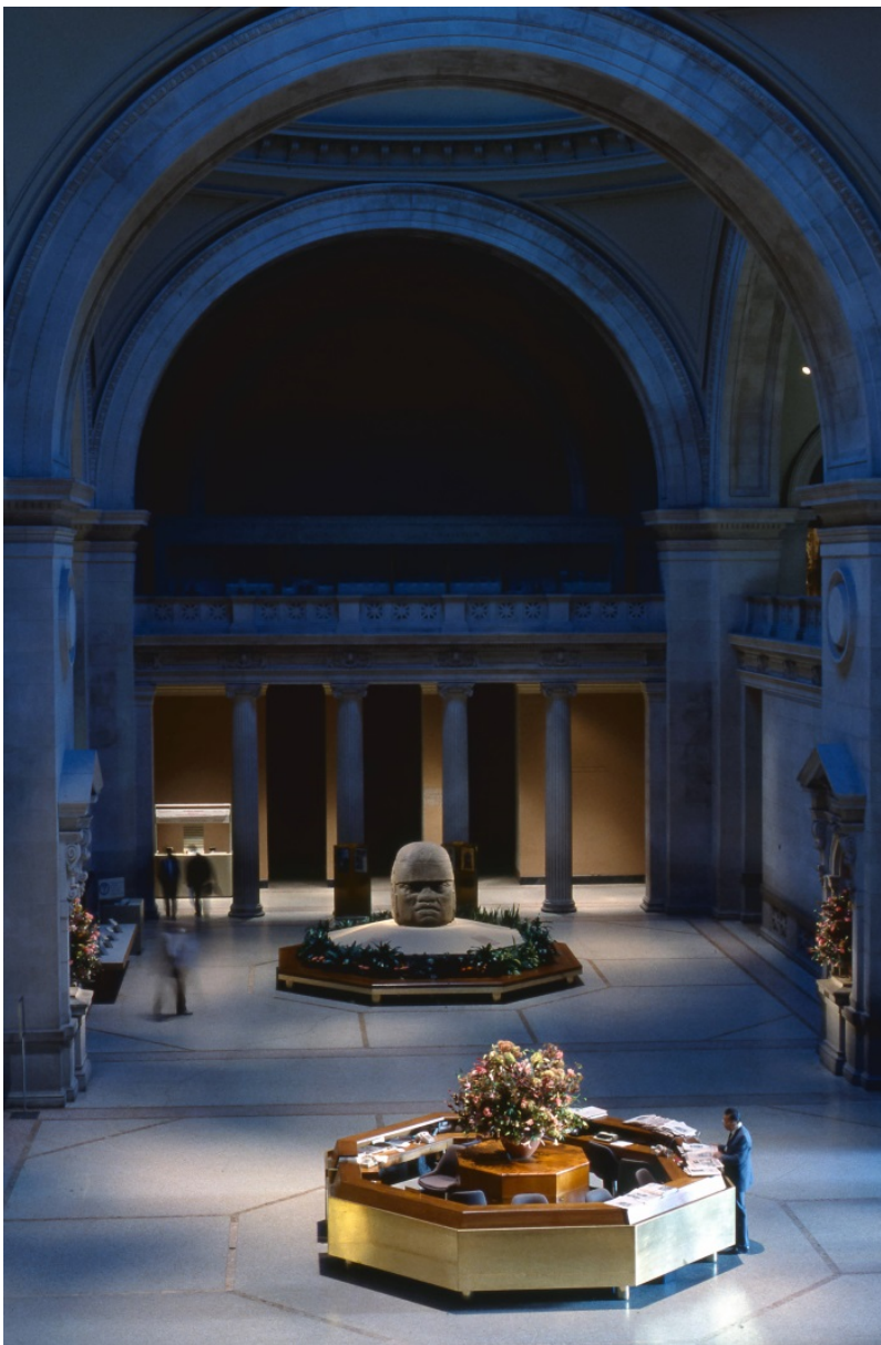
Exposición México: esplendores de treinta siglos en el Metropolitan Museum of Art de Nueva York en 1990

En el periodo mencionado, la diplomacia cultural fungió como un importante apoyo en las estrategias de la política exterior mexicana. En el contexto de las negociaciones del TLCAN, las instituciones culturales y el sector privado colaboraron para dar a conocer en los Estados Unidos las expresiones artísticas y culturales más relevantes en la historia de México. La dirección de todos estos empeños recayó en una amplia variedad de actores e instituciones, entre las que podemos destacar a Rafael Tovar y de Teresa, Titular del Consejo Nacional para la Cultura y las Artes (CONACULTA), José Sarukhan Kermez, Rector de la UNAM, Manuel Camacho Solís, Jefe del Departamento del Distrito Federal, al poeta e intelectual Octavio Paz, así como la Asociación Amigos del Arte encabezados por Emilio Azcárraga Milmo, Director de Televisa, la cadena de televisión privada más importante del país. Este gran esfuerzo institucional y privado se condensó en un festival denominado México: esplendores de treinta siglos que se inauguró en octubre de 1990 en el Museo Metropolitano de Nueva York. En esta sede duraron tres meses las expresiones y manifestaciones artísticas y culturales de México para posteriormente (en 1991) mudarse al Museo de Arte de San Antonio y al County Museum of Art de los Ángeles, California.