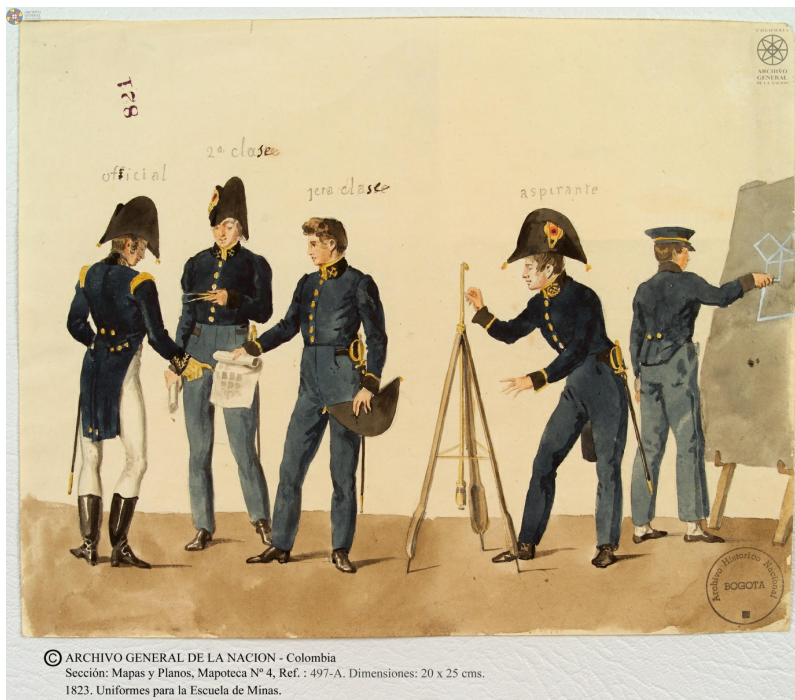
Uniformes de la Escuela de minas, attribué à François-Désiré Roulin, 1823