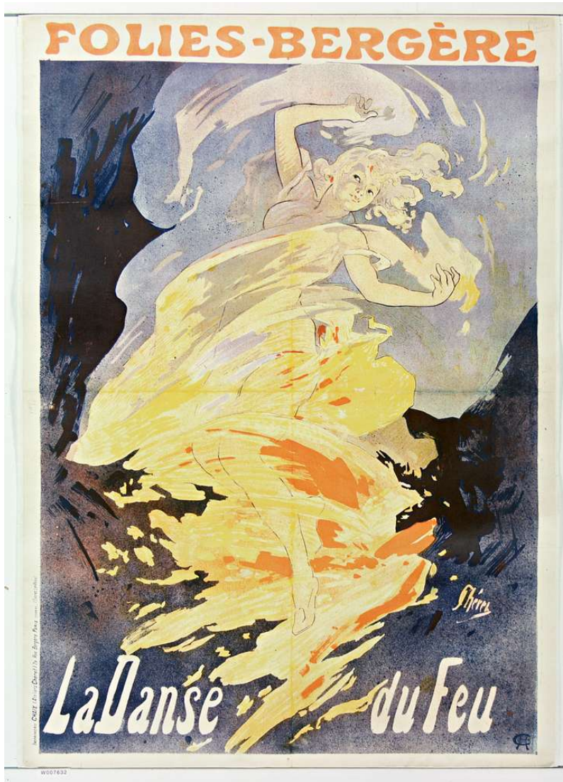
Jules Chéret, affiche La Danse du Feu de Loïe Fuller, 1897

l'imagination et la transporte dans un rêve de féerie 27 ». L'évocation de cet art tout de suggestion, qui dérobe son principe technique aux regards du spectateur, permet à Bing de l'inscrire dans l'orbite du symbolisme, à laquelle l'écriture artiste est intimement liée, et de l'acclimater au goût des écrivains et amateurs d'art français.