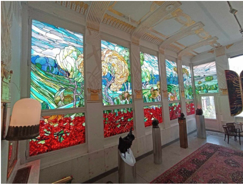
Verrière Tiffany (1900) dans une aile de la villa Otto Wagner, Ernst Fuchs, Vienne