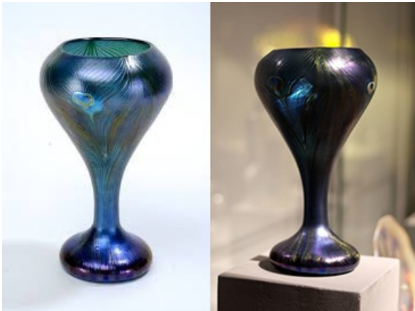
Louis Comfort Tiffany, Vase Paon , c. 1898