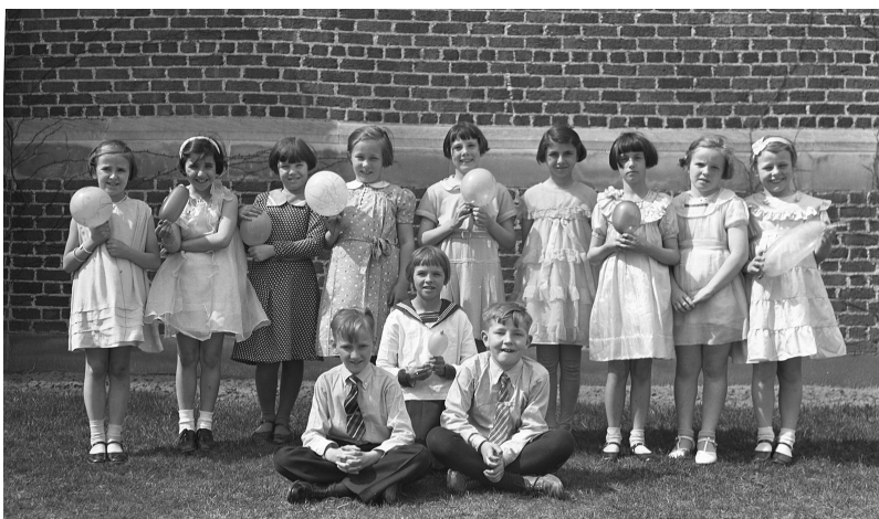
Elèves de l'Ecole pour les sourds de l'Ontario (maintenant Ecole Sir James Whitney pour les sourds) à Belleville, Ontario, entre 1936 et 1939

Mettre en lumière la diversité des éléments que renferme le terme « éducation » dans une perspective transatlantique : tel est l'objectif de cette rubrique. Les articles abordent les institutions et les politiques éducatives ; les courants et mouvements d'idées ayant pour objet l'éducation ; les savoirs pédagogiques et les contenus des enseignements, mais aussi le cadre matériel dans lesquels ils sont dispensés. Le tableau ne serait pas complet sans une attention portée aux acteurs : enseignants, pédagogues, publics visés, fonctionnaires nationaux ou internationaux, experts, etc.