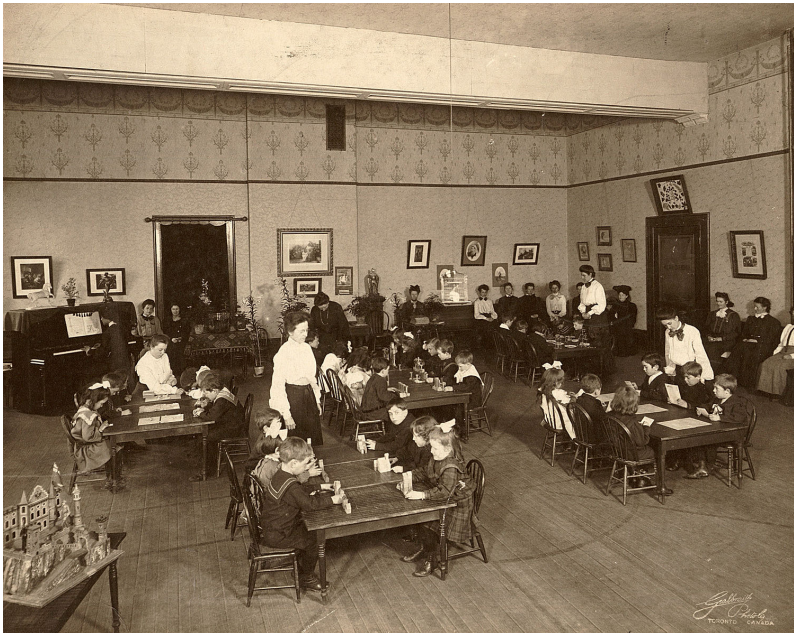
Les élèves-enseignants pratiquent l'enseignement de la maternelle à l'Ecole normale de Toronto, Canada (v. 1898)

Par ailleurs, il convient d'être attentif aux dynamiques de résistances, de resémantisations et d'hybridations auxquelles donnent lieu ces circulations en matière éducative, ce qui suppose de travailler sur l'imbrication des échelles locale, nationale, régionale et internationale.