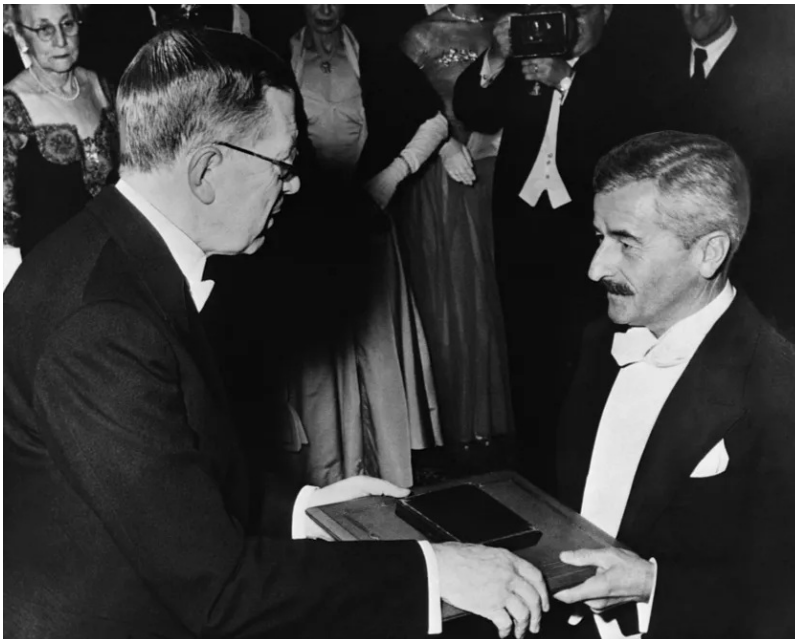
En 1950, William Faulkner reçoit le prix Nobel de littérature 1949 des mains du roi Gustave VI Adolphe de Suède

La réhabilitation de Faulkner aboutit à une distinction internationale, le prix Nobel de littérature obtenu en 1950 au titre de 1949. Une reconnaissance chèrement acquise, toutefois, puisque l'Académie suédoise s'était divisée sur une œuvre jugée crue et immorale par certains. Réticent à faire le voyage à Stockholm, Faulkner céda à l'insistance de l'ambassadeur des États-Unis en Suède dut insister et son discours, qui soulignait le message humaniste de son œuvre à l'heure de la menace d'anéantissement nucléaire généralisé, plut au public, aux autorités et aux critiques. Un ambassadeur culturel était né.