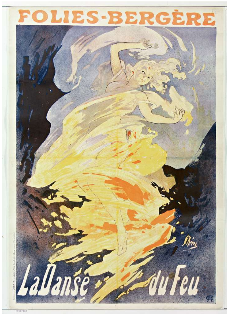
Jules Chéret, affiche La Danse du Feu de Loïe Fuller, 1897

l'imagination et la transporte dans un rêve de féerie 27 ». L'évocation de cet art tout de suggestion, qui dérobe son principe technique aux regards du spectateur, permet à Bing de l'inscrire dans l'orbite du symbolisme, à laquelle l'écriture artiste est intimement liée, et de l'acclimater au goût des écrivains et amateurs d'art français.