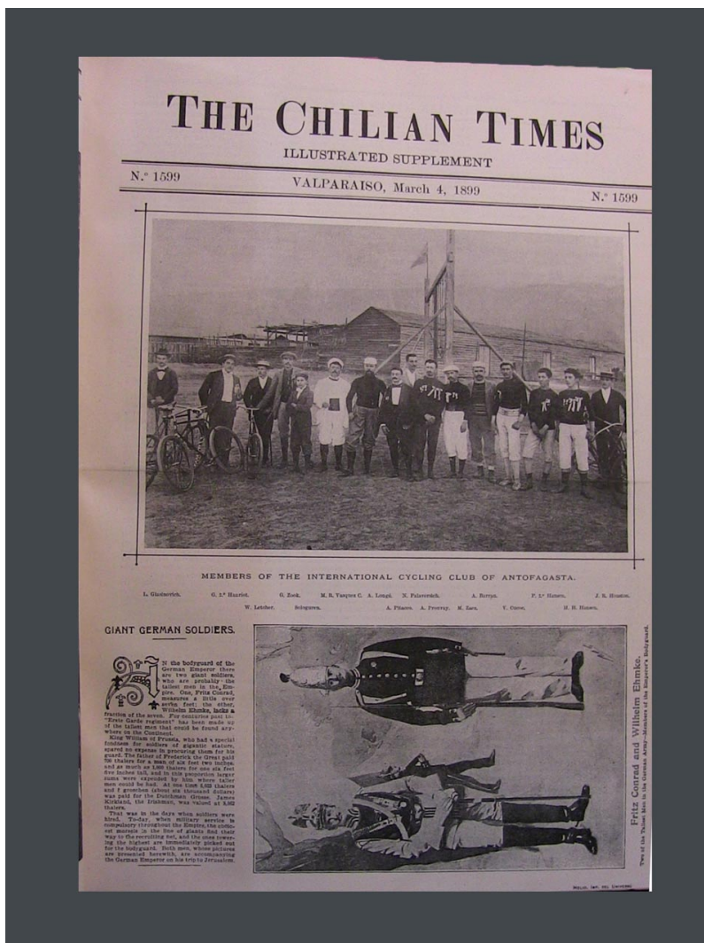
The Chilian Times , 4 mars 1899