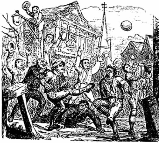
Match de folk ou de mob football à Londres (1721)